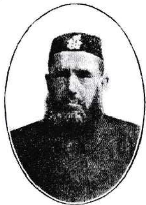
40 باشارند .