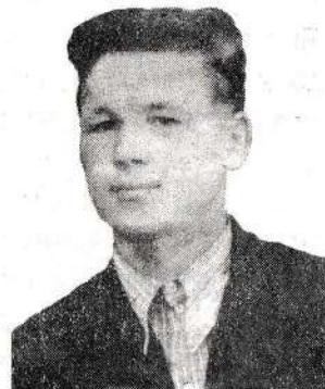
Минем 1951 елда 16 яшемдә төшкән фотосүрәтем

Менә замана! Ә без үскәндә кызмача егет очраса аның белән кызы-егете аралашмады, аңа нәфрәт белән карыйлар иде. Клублар суык булганга, безнең күңел ачу, очрашу урыны булып аулак өйләр торды. Анда да кызлар көртмәсә, барып керә