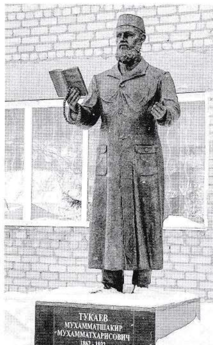
Мөхәммәтшакир Тукаев һәйкәле.