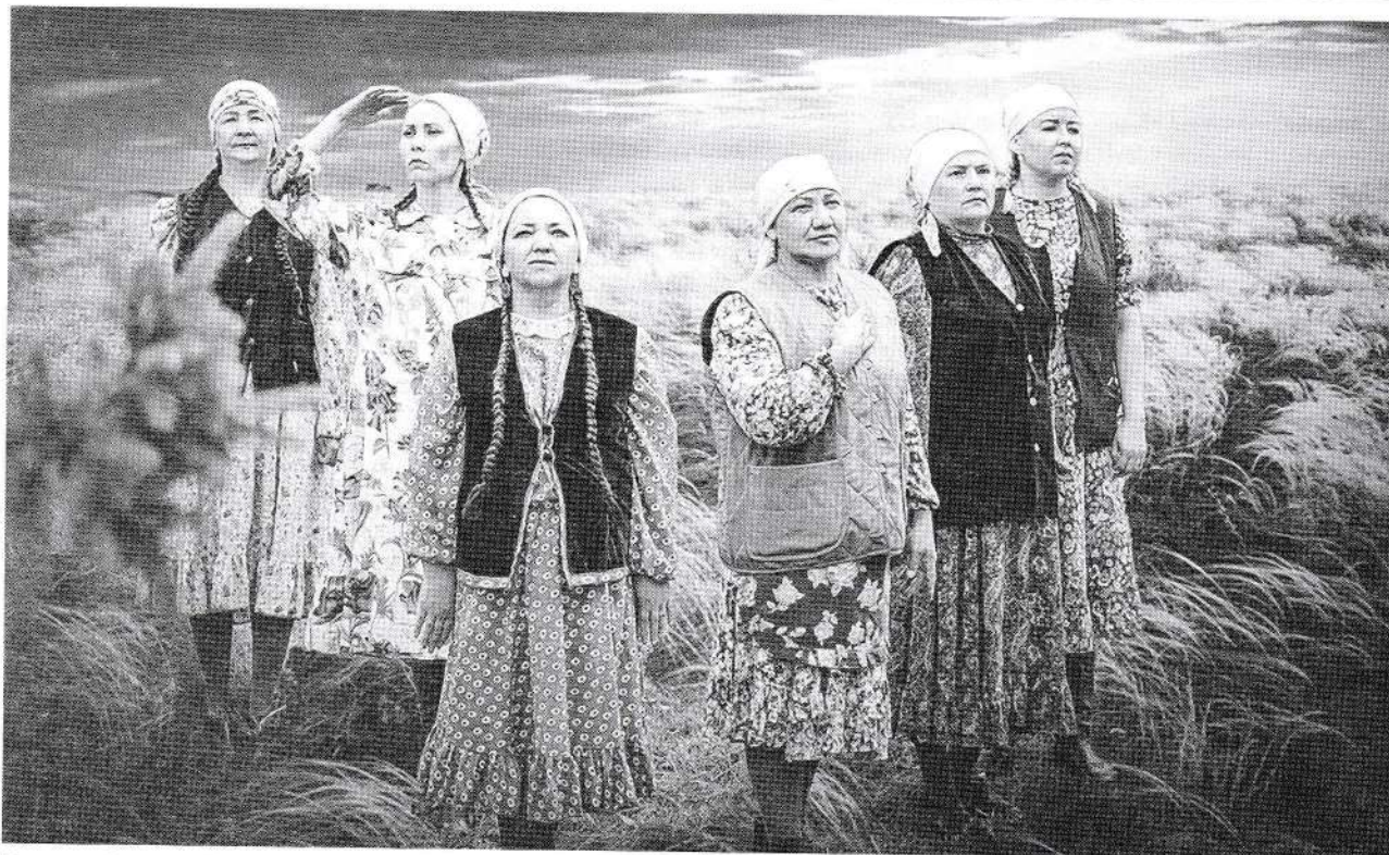
Бүгөнгө Стәрлебаш хатын-кызлары тыл хезмәтчәннәре ролендә.