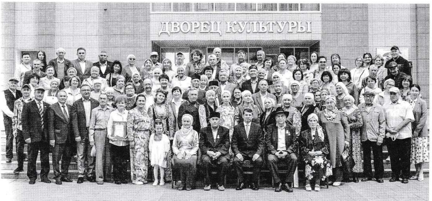
Стәрлебашлылар һәйкәл ачу тантанасында. 2025 ел, 20 июнь.